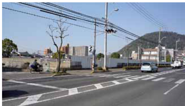
室町新田線(花ノ宮町)の県有地

栗林小学校改築に関し栗林小PTAと栗林校区連合自治会は、教育環境と安心安全の町づくりの観点から花ノ宮町の県有地を校舎改築の第一候補に挙げ、市長他関係者に要望。本来なら本年度基本設計に入る予定だったが、教育委員会では本年度中に建設候補地の方向付けをしたいとの意向。