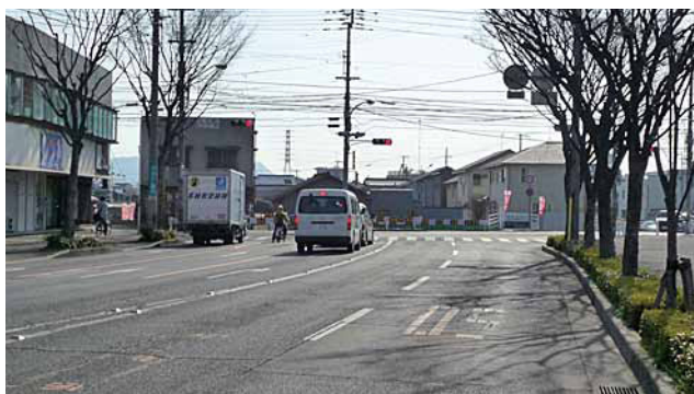
木太鬼無線から上之町三条工区(前方)

都市計画道路木太鬼無線のうち三条工区・木太工区で調査費2,190万円がついた。この路線は昭和44年に地元説明会