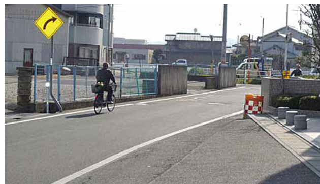
御坊川手前のカーブする県道を直線に

が開催されて以来進捗無し。三条工区は塩江街道と伏石街道区間700m。区間には琴平電気鉄道、御坊川があることから、一部高架を予定。本年度は路線測量等を行い、早急に国の認可事業を受けたい意向。また、高松一高前から今里町に通じる都市計画道路公園東門線の御坊川手前を直線にする調査費1,130万円余もついた。