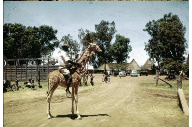
（上）2枚モンバサ港での積み込み風景。 （下）2枚はカー・ハートレー農場風景。

編集後記 今回は（財）栗林公園動物園歴史の戦後史の一端を紹介。議会情報はこちらのQRを参照